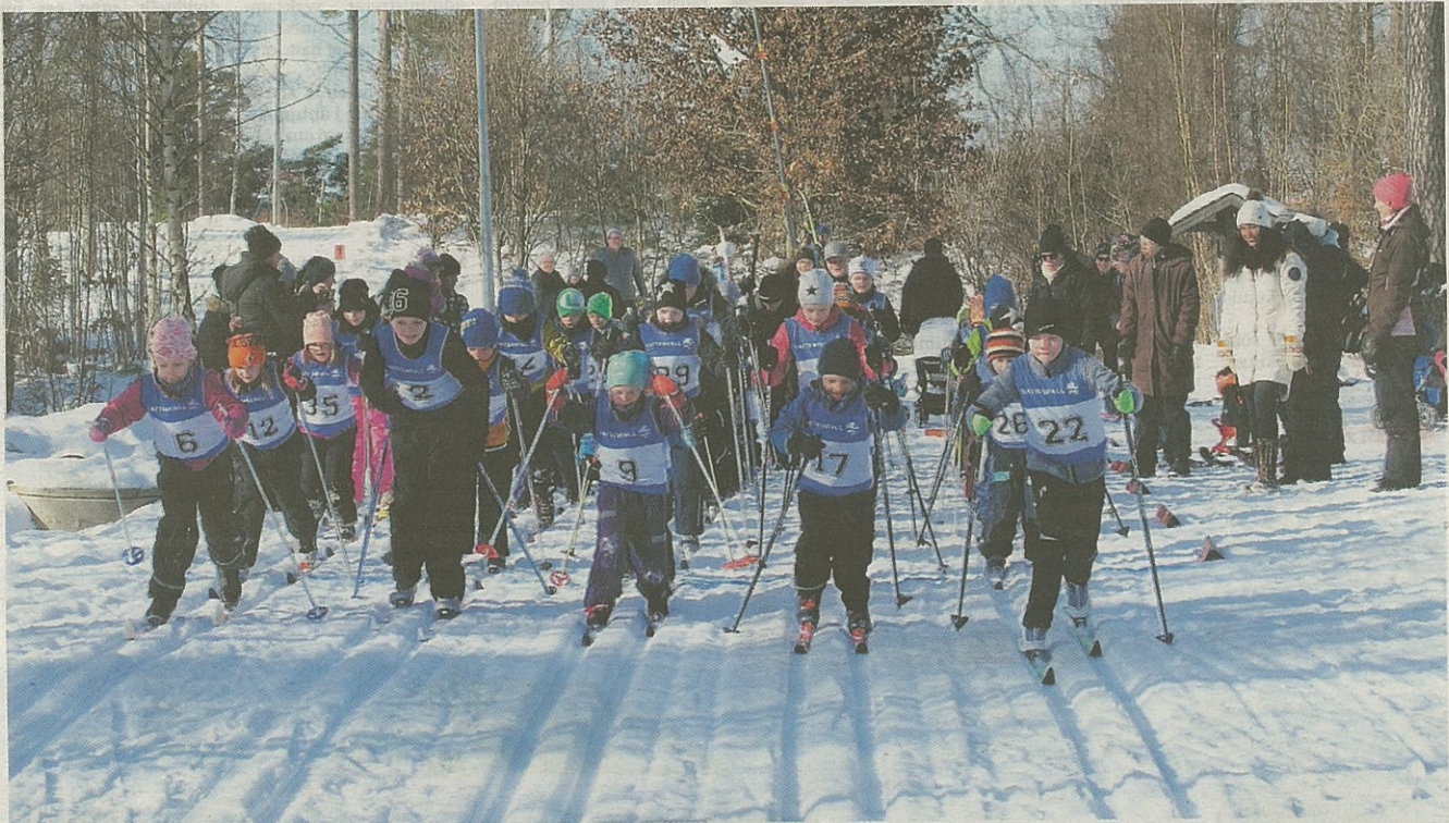
Starten har gått – med närmare 50 barn på startlinjen. Många av dem "veteraner".

Förutsättningarna för årets Barnvasan i Rödeby i lördags kunde inte varit så mycket bättre; tvättakta snö, bra spår, strålande sol – och så alla färska, peppande OS-framgångar.