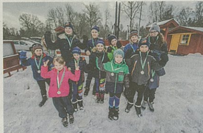
Alla barn var så klart nöjda efter sina lopp där alla fick en medalj som pris.