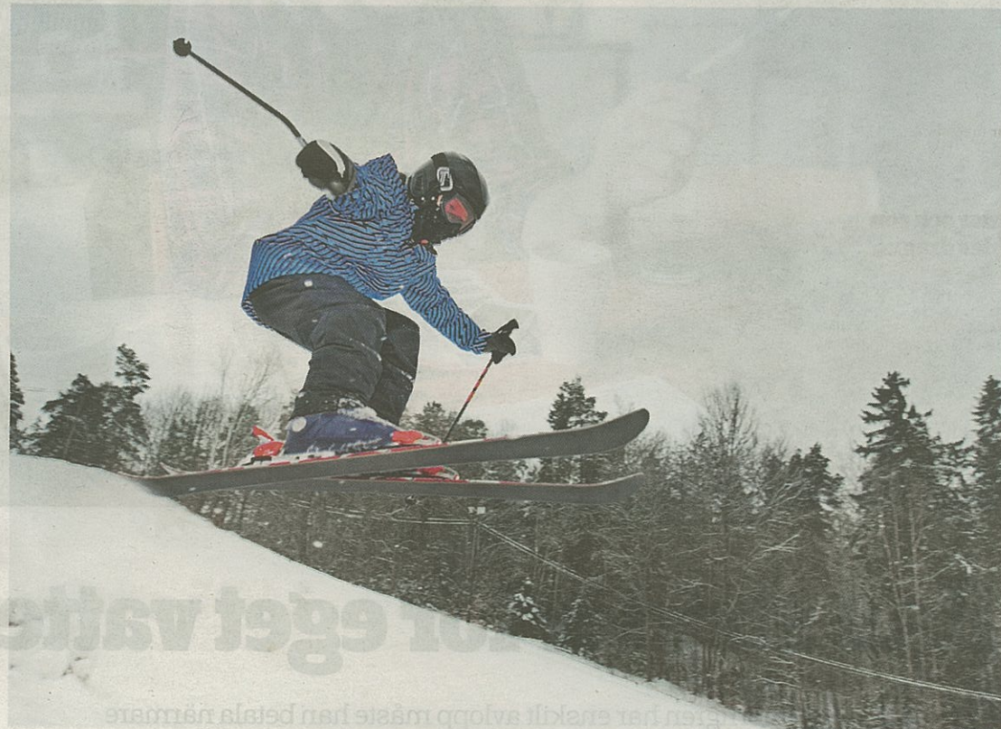
Många har passat på att testa konstsnön i Rödebybacken. Bilden är tagen vid ett tidigare tillfälle.

- Det är alltid en stor farhåga när man är en liten, ideell förening, men vi har