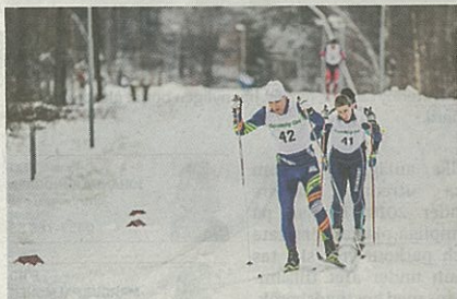
30 kilometer var det som gällde för en del under skidåkning i Karlsnäs.