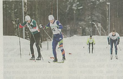
Tack vare konstsnön så har det blivit riktigt fina spår i Karlsnäs.