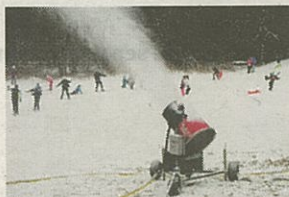
Åtta snökanoner har arbetat för högtryck i veckan för att fylla backen.