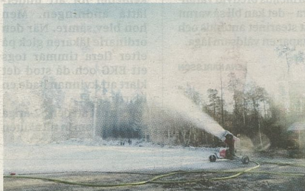
Snökanon i aktion vid det som ska bli skidstadion i nya Rödeby vintersportcentrum.

Målet är att producera ett 70 centimeter tjockt snölager för att ha spår som håller in i mars. Vatt­net hämtas från Silletorpsån och sprutas ut i fryst form bit för bit i spåret.